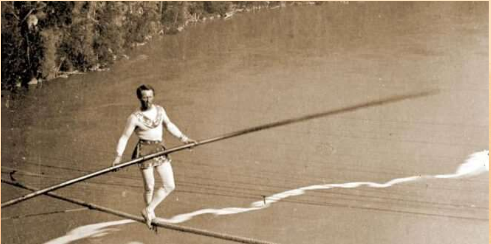
查尔斯布朗汀 Charles Blondin (1824年2月28日 — 1897年2月22日)